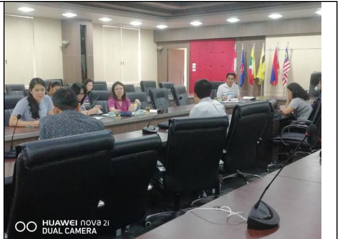
ครั้งที่ 2 วันที่ 23 มีนาคม 2561 เวลา 09.00-11.30 น.