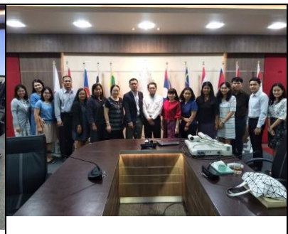
ครั้งที่ 3 วันที่ 20 เมษายน 2561 เวลา 09.00-11.30 น.

ผู้เข้าร่วมกิจกรรม คณะกรรมการ KM ด้านงานวิจัย ร่วมกับ คณะกรรมการ KM การเรียนการสอน